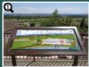
1 BALCON DE PARAZA TABLE D'ORIENTATION