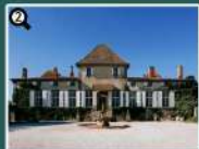
2 CHÂTEAU DE PARAZA